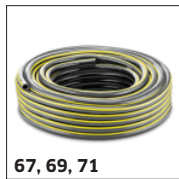
67, 69, 71