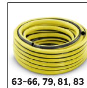
63-66, 79, 81, 83