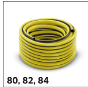
80, 82, 84