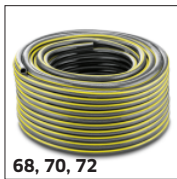
68, 70, 72